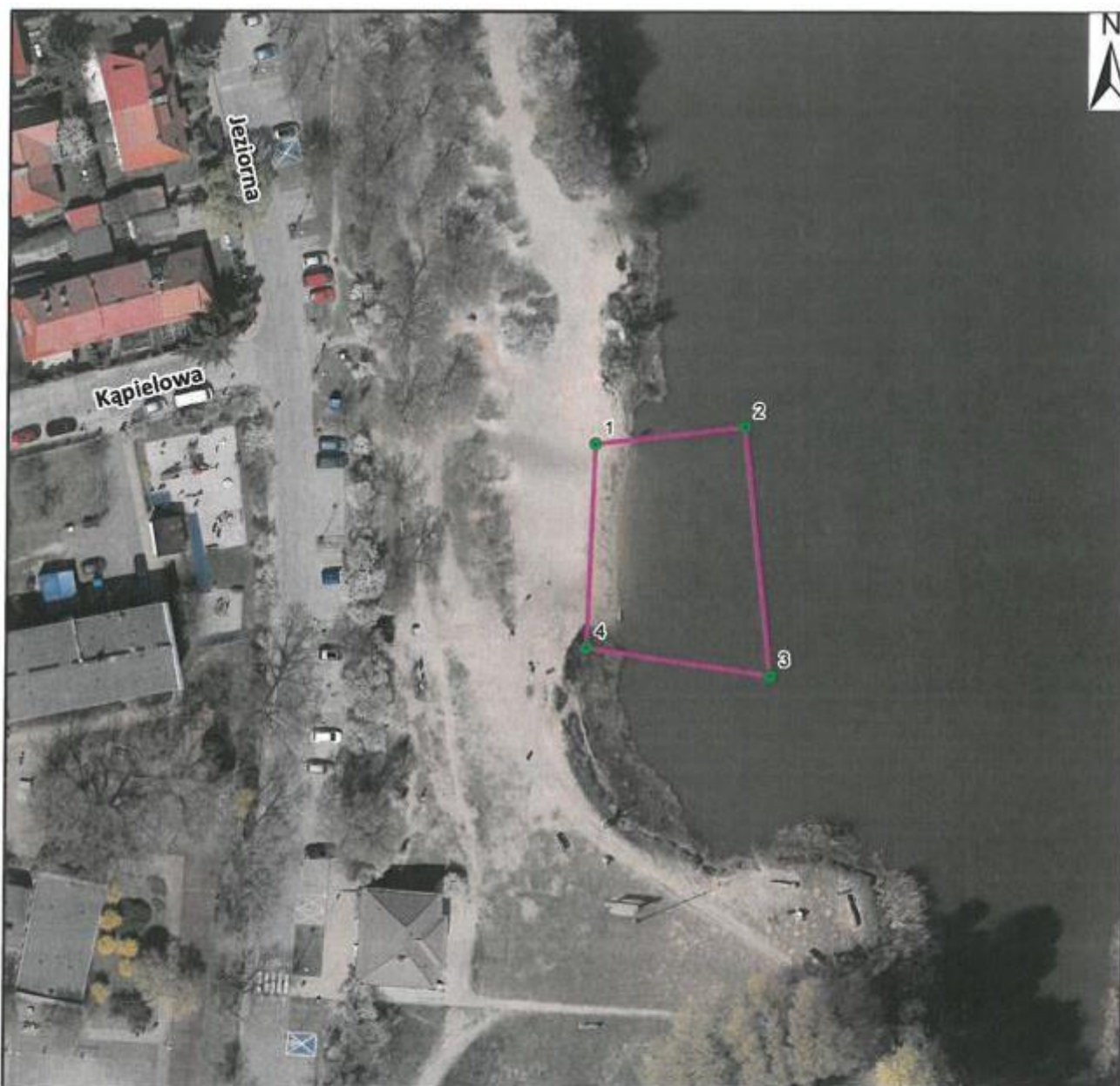
Rysunek nr 2. Lokalizacja kąpieliska (załącznik do uchwały nr LXIII/2072/2022)

Profil wody w kąpielisku zlokalizowanym na Jeziorku Czerniakowskim przy ul. Jeziorna 4, Dzielnica Mokotów M.St. Warszawy (Aktualizacja)