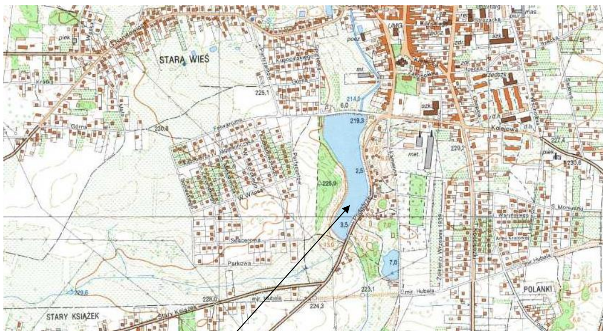
Mapa 1. Lokalizacja Zalewu w Szydłowcu.