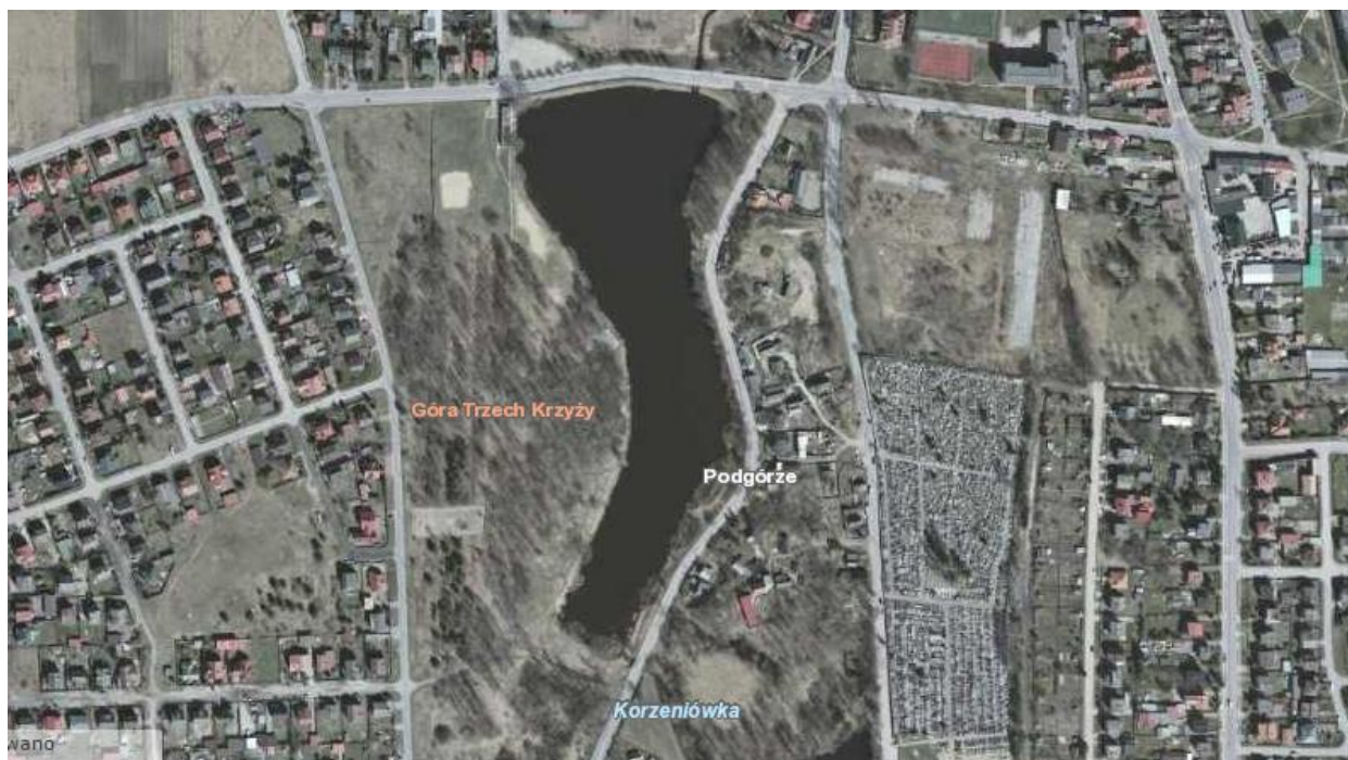
Mapa 2. Zalew w Szydłowcu.