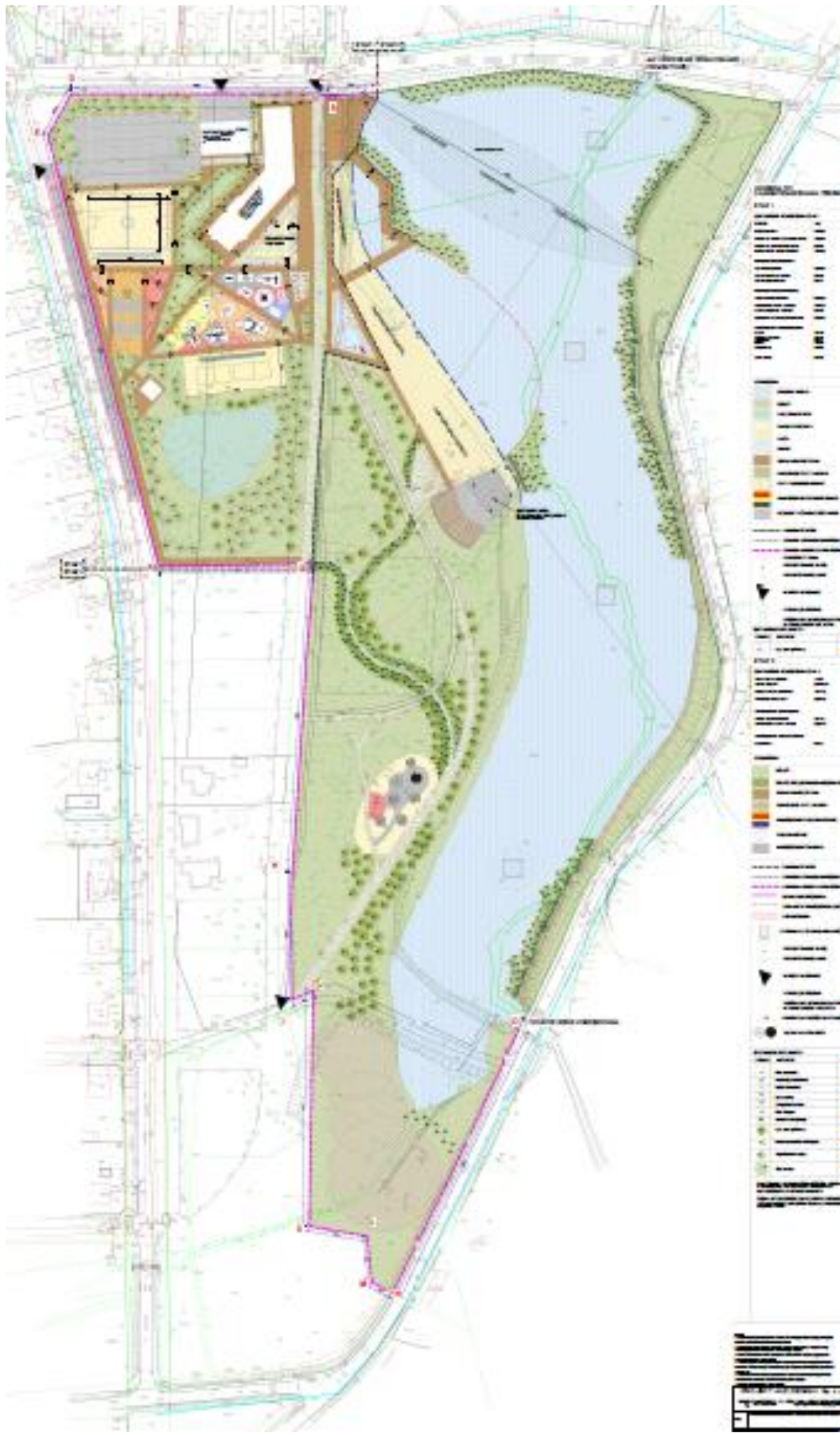
Mapa 3. Zalew w Szydłowcu. Plan zagospodarowania