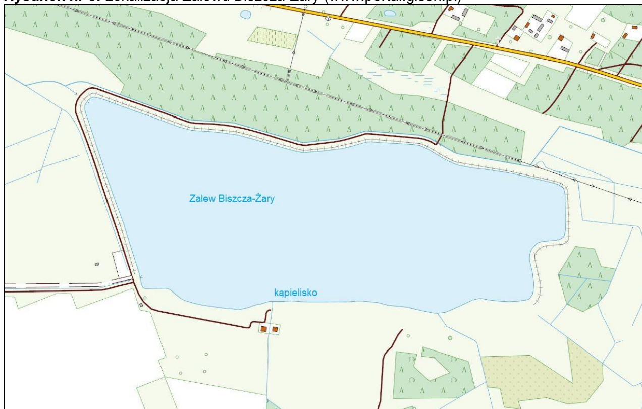
Rysunek nr 3. Lokalizacja Zalewu Biszczka-Żary ( www.portal.gison.pl )

Projekt budowy zbiornika wodnego Biszczka-Żary zakończono w maju 2008 roku. Zbiornik ten przyczyni się do poprawy stanu bezpieczeństwa przeciwpowodziowego. Liczba miejscowości zabezpieczonych przed powodzią: Biszczka, Wólka Biska, Żary, Gózd Lipiński, Suszka, Budziarze. Poprzez realizację projektu nastąpi poprawa stanu środowiska naturalnego i poprawa warunków życia mieszkańców regionu. Zbiornik ten jest także czynnikiem kształtowania krajobrazu, wzbogacania walorów przyrodniczych i estetycznych,